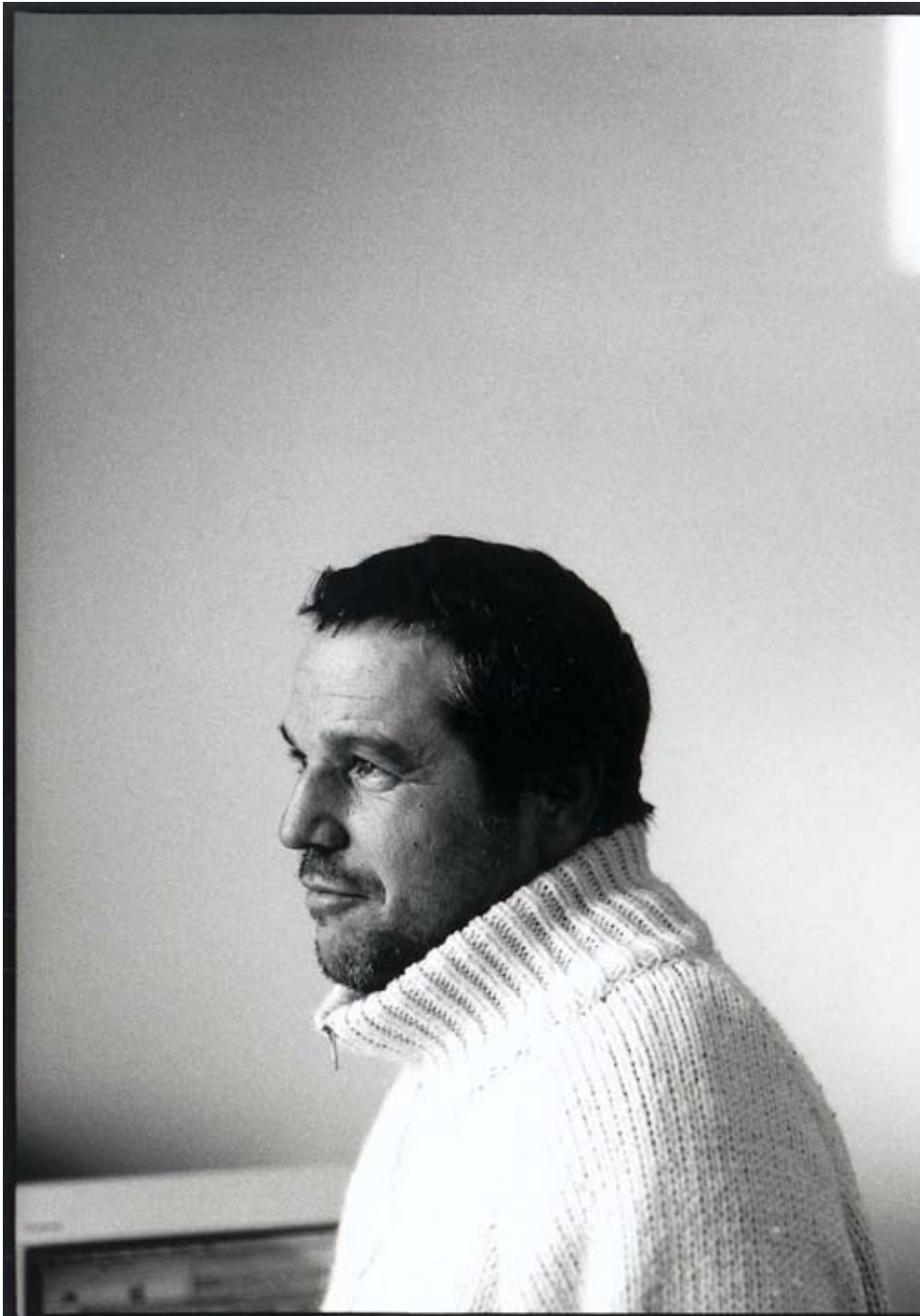
Serge Verstockt