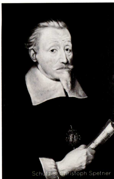
Schütz

Qua stijl is het oeuvre van Schütz een toonbeeld van diversiteit. Uit zijn Il primo libro de madrigali (1611) blijkt hoe goed hij wel geluisterd had naar de muziek van Monteverdi. De verregaande dramatiek van deze muziek gaat gepaard met een wel erg gewaagde harmonische schrijfwijze. In zijn Cantiones Sacrae toont Schütz dan weer dat hij ook de oude contrapuntische technieken goed onder de knie had. Op dat vlak breid Schütz een vervolg aan de traditie die nog voortkwam van Orlandus Lassus. ■